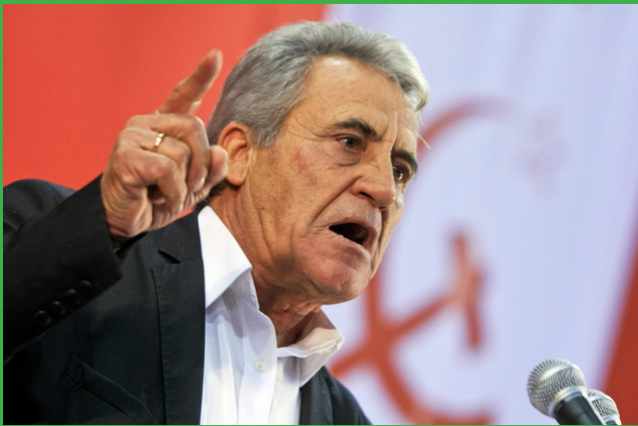
O PCP quer reganhar Câmaras como Loures ou Évora... com o BE era mais fácil