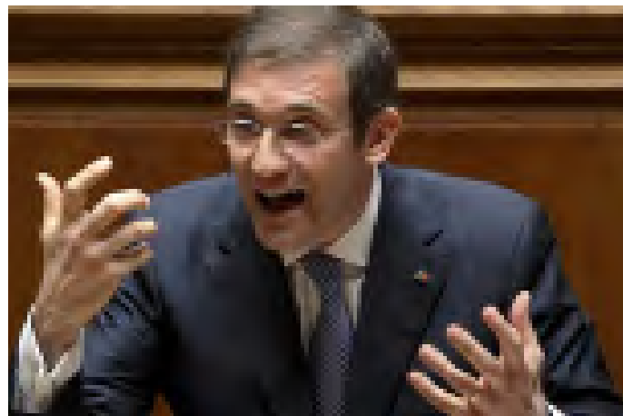
Passos diz que estamos a sair da crise mas prepara mais cortes

Já ninguém acredita neste governo. É urgente tirá-lo do poleiro para acabar com a austeridade e criar emprego. Por isso é preciso continuar as lutas, fazer novas manifestações, como em Setembro do ano passado. É também preciso castigar o governo nestas eleições autárquicas. E dado que PS apoia também a troika e é responsável pelo estado do país, é necessário votar à esquerda, seja nos movimentos independentes que o MAS apoia, seja no Bloco de Esquerda e PCP, apesar de, infelizmente, concorrerem divididos.